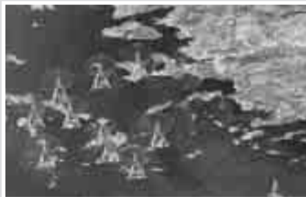
Σε απολογία κάλεσε το ΕΣΡ 21 ραδιοσταθμούς των Κυκλάδων

Αξιοπρόσεκτο είναι ότι μεταξύ των ραδιοσταθμών βρίσκεται και η ΕΡΑ Αιγαίου που εκπέμπει από τη Σάμο. Όλα αυτά γίνονται τη στιγμή που η συζήτηση για τις εξελίξεις στον τομέα των Μέσων Ενημέρωσης έχει ανάψει για τα καλά. Η εκτίμηση είναι ότι αυτή η κλήση σε απολογία, είναι μιας πρώτης τάξης ευκαιρία να κατανοήσει ένας ακόμα φορέας της πολιτείας τις ιδιαιτερότητες του Νομού Κυκλάδων και των νησιών γενικότερα. Σημειώνεται ότι η πρώην κυβέρνηση είχε ανακοινώσει